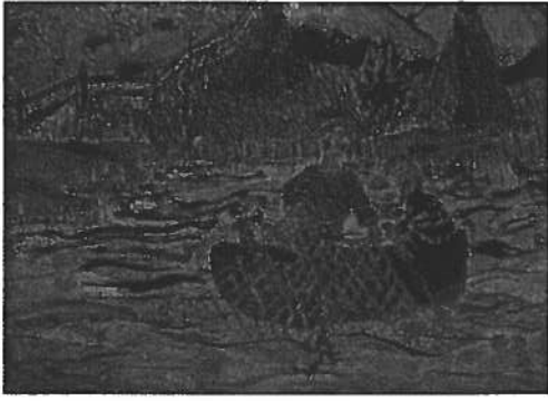
3. Mari-Selina Kärki, Dušše guovtti čuovžža geažil

7 - 9 –luohkkálaččat ja logahat: Buot bálkkašumit manne Ohcejoga sámelogahaga oahppiide. / 7-9 luokkalaiset, lukio: Kaikki palkinnot menivät Utsjoen saamelaislukion oppilaille.