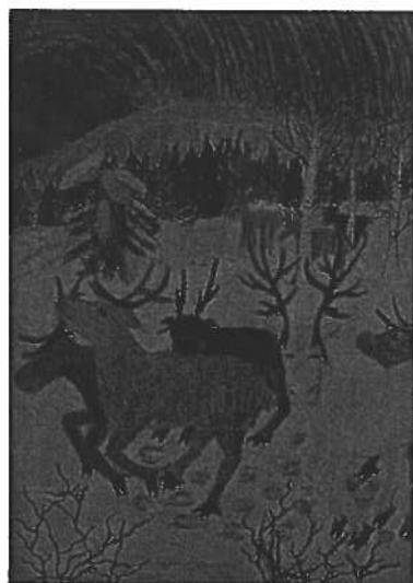
1. Raija Harju, Eallu

4 - 6 -luokkalaččat: Buot bálkkašumit manne Bealdovuomi skuvlla oahppiide. / 4-6 luokkalaiset: Kaikki palkitut olivat Peltovuoman koulun oppilaita.