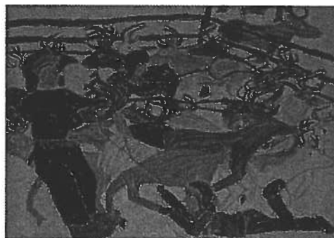
2. Suoma Keskitalo, Boazu jođálmahtá