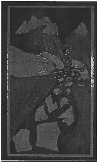
1. Joni Saijets, Jienat vulget

7 - 9 –luohkkálaččat ja logahat: Buot bálkkašumit manne Ohcejoga sámelogahaga oahppiide. / 7-9 luokkalaiset, lukio: Kaikki palkinnot menivät Utsjoen saamelaislukion oppilaille.