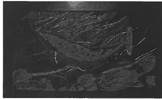
2. Reo Virtanen, Rávdu