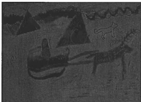
1. Terhi Yli-Yrjänäinen, Gollečoarvi

0 – 3 -luokkalaččat: 1. ja 2. bálkašumit manne Bealdovuomi skuvlla ja 3. bálkašupmi Gárasavvona skuvlla oahppiide. / 0 -3 luokkalaiset: 1. ja 2. palkinto menivät Peltovuoman koulun ja 3. palkinto Kaaresuvannon koulun oppilaille.