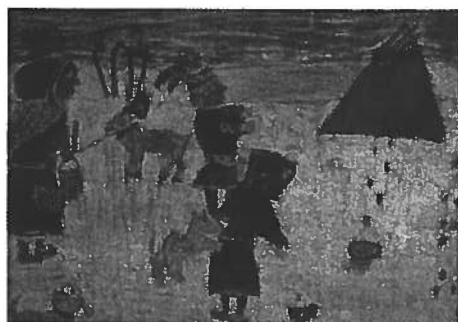
2. Sari Stoor, Ruovttubargu

4 - 6 -luokkalaččat: Buot bálkkašumit manne Bealdovuomi skuvlla oahppiide. / 4-6 luokkalaiset: Kaikki palkitut olivat Peltovuoman koulun oppilaita.